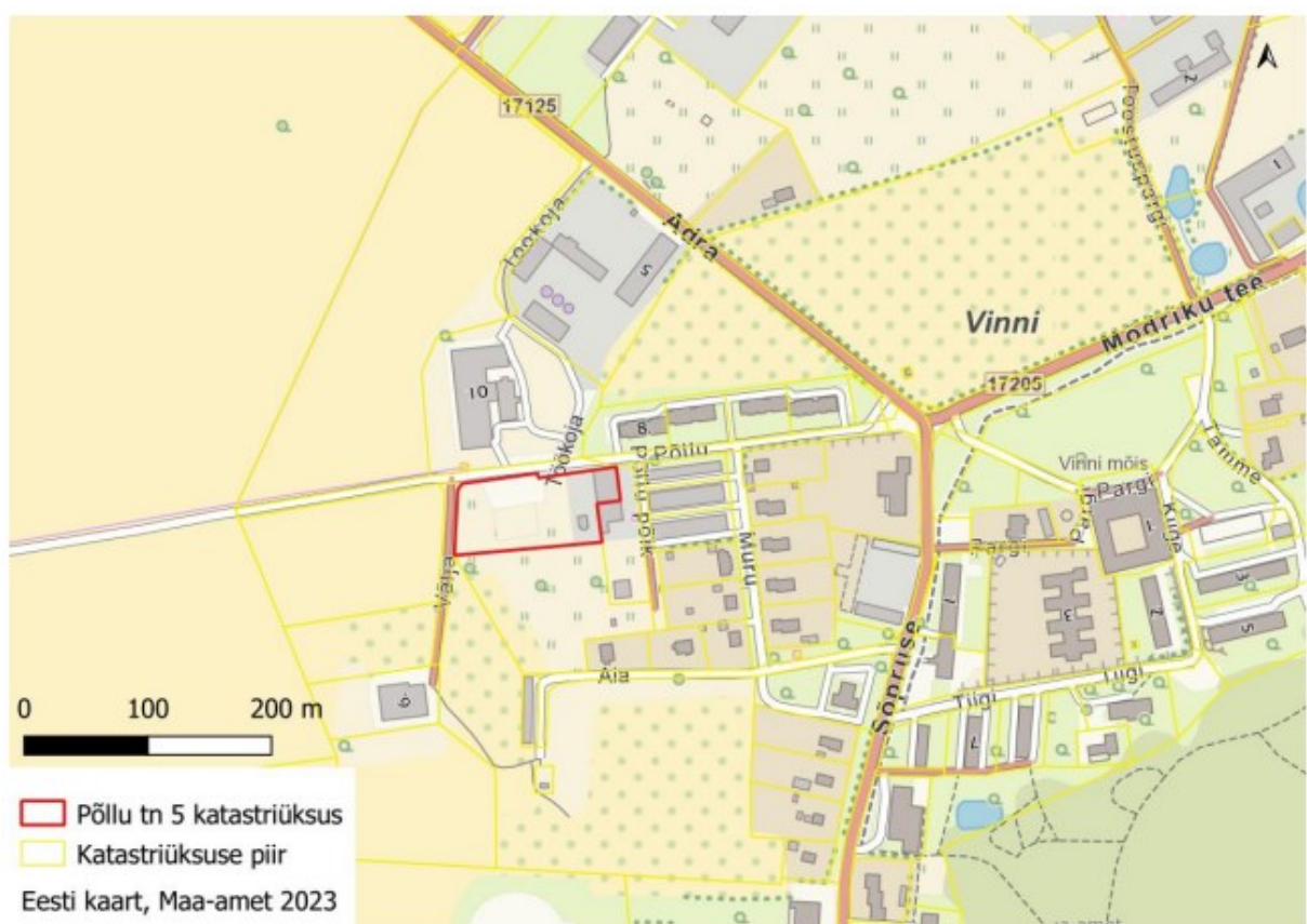
Joonis 1. Põllu tn 5 paiknemine.

Keskkonnaamet algatas kavandatavale tegevusele KMH 07.07.2022 kirjaga nr DM-118905-9 .